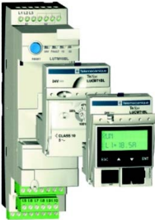
Unité de contrôle multifonction